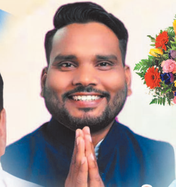
मान. तरुण व्यवहार जी उपाध्यक्ष, जनपद पंचायत बागबाहरा